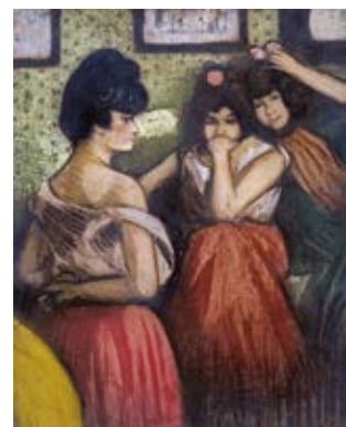
Interior con tres muchachas , c. 1906-1911. Aguafuerte en color sobre papel. Colección Familia Pichot