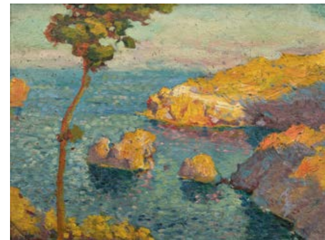
Cala Nans, Cadaqués , c. 1900. Óleo sobre cartón. Colección Familia Pichot