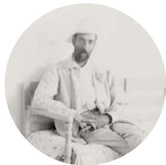
Fotografia de Ramon Pichot.