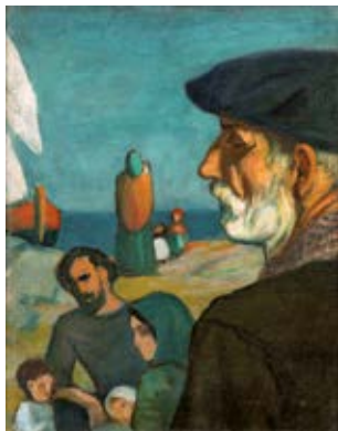
Pescadores , c. 1903. Óleo sobre tela. Colección particular

en Barcelona, Bilbao y París. En 1922 abandonó su ciudad de acogida y se trasladó unos meses a Marsella: las obras de ese período se expusieron en Madrid un año después con gran éxito.