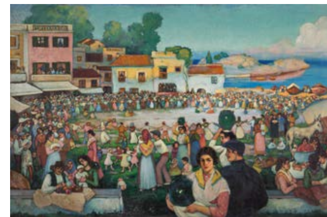
Sardana , c. 1921. Óleo sobre tela. Colección Familia Pichot