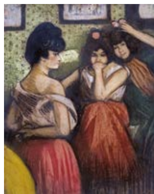
Interior amb tres noies , c. 1906-1911. Aiguafort en color sobre paper. Col·lecció Família Pichot