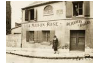
Fotografia de la família Pichot (Ramon estirat al terra i els pares asseguts).