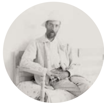
Fotografía de Ramon Pichot.

En París, Pichot conoció a Germaine, una joven francesa musa de artistas con la que se casaría unos años más tarde. Participó en la sala de los fovistas del Salón de Otoño de 1905, que provocó un gran escándalo. Integrado en la vida francesa, dio testimonio de la Primera Guerra Mundial con una serie de dibujos que expuso durante el conflicto